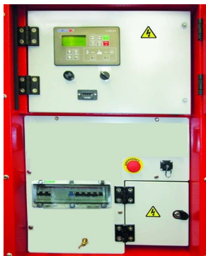
PANEL DE SALIDA ACP

Bornero para conexión desde ACP al cuadro LTS.